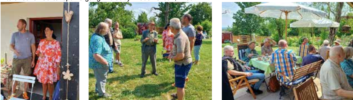
Besuch des DRK-Bistro im Vereinsgarten, 6. Juni