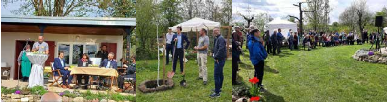
Blütenhocketse mit Festakt, 23. April