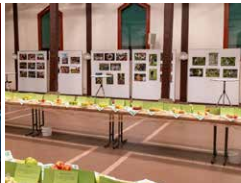
Apfelsorten- und Fotoausstellung 11./12. November