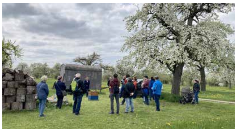
Tag der Streuobstwiese – Rundwanderung mit Zwischenstopp beim Imker