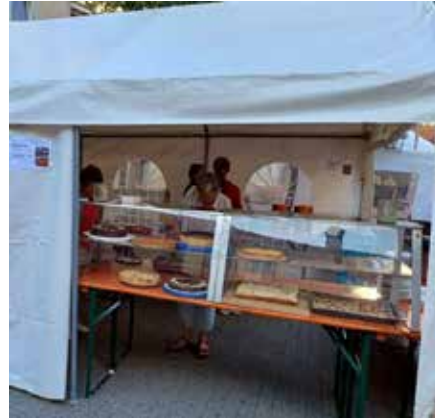
Erntefest 9. September