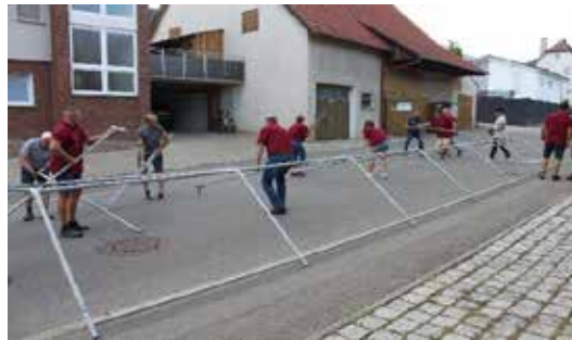
Kirschenfest 2. Juli

Spiel ohne Grenzen der örtlichen Vereine