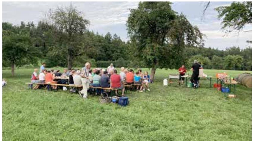
Jahreshauptversammlung mit anschließendem Vereinsfest

Unsere im Jahr 2024 geplanten Aktivitäten: