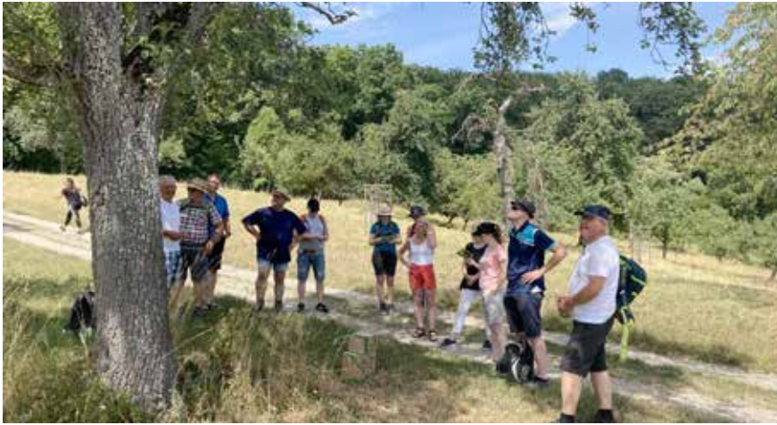
Hagellocher Birnenrundweg – Verkostung sortenreiner BirnensäHe