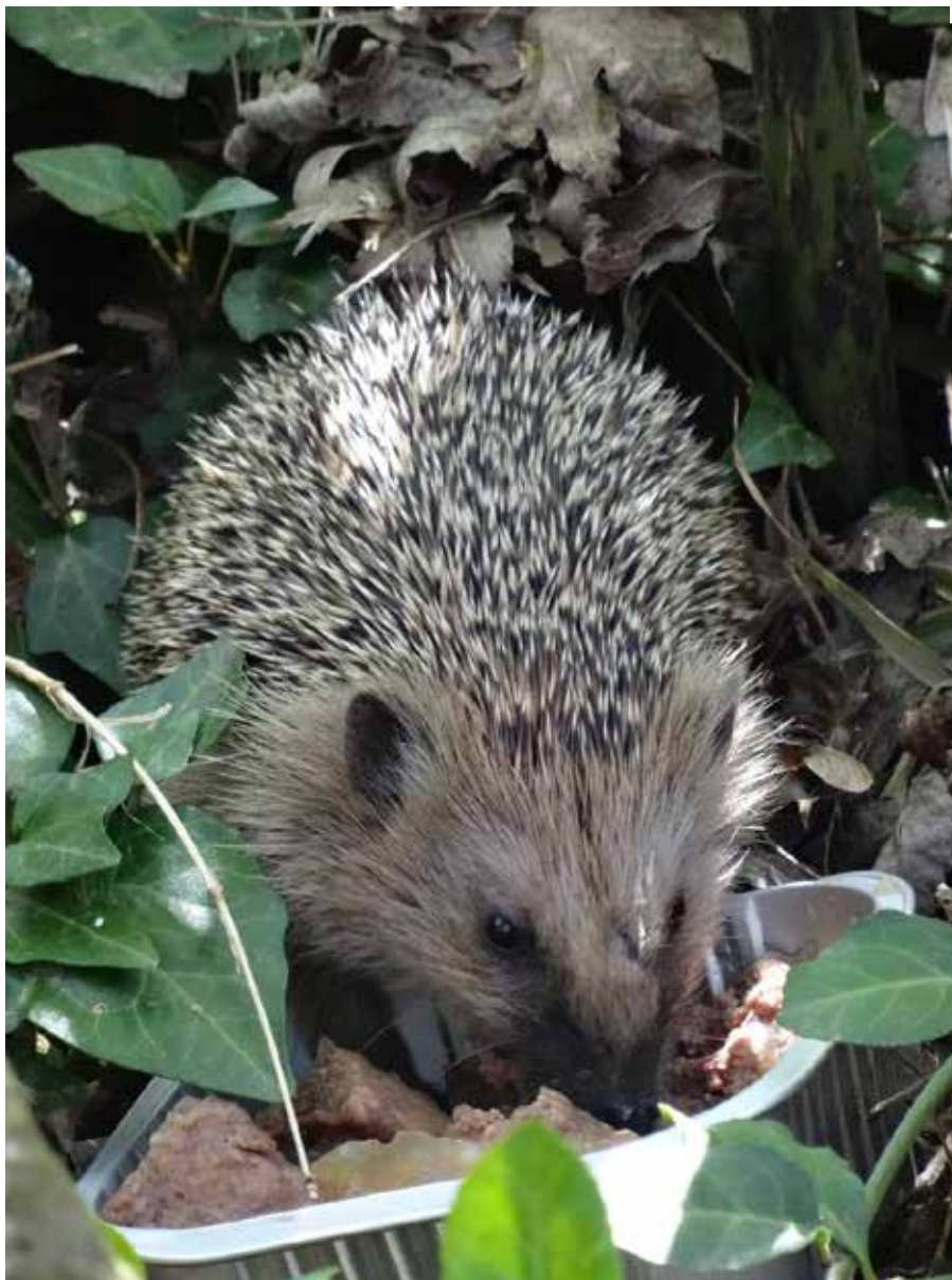
Der Igel. Tier des Jahres 2024

Rückblick auf das zurückliegende Jahr 2023 sowie die Vorschau der Ortsvereine und des Kreisverbandes auf 2024.