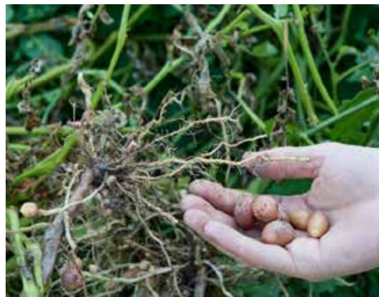
Kartoffelernte im Vereinsgarten, 8. September