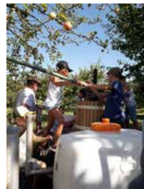
Körbe voll Äpfel zur Verarbeitung.

Um den Kindern die Herstellung eines natürlichen Apfelsaftes zu zeigen, konnten sie zum Abschluss der diesjährigen Kinderferientage beim OGV im Obstsortenmuseum Häsel ihren eigenen Apfelsaft herstellen. Bei heißen Temperaturen waren die Kinder fleißig damit beschäftigt, reife Äpfel aufzuwaschen, zu waschen um sie anschließend im Muser zu schreddern und das Mus in der Spindelpresse unter Einsatz ihrer Muskeln auszupressen. Der Erfolg war bald sichtbar. Leckerer Apfelsaft floss in Strömen. Die Kids konnten es kaum erwarten, bis sie den ersten, selbst gepressten Saft probieren durften. Mmmm . . . wie lecker! Selbst Kinder, die sonst keinen Saft trinken, waren vom Ergebnis so begeistert und hatten in Windeseile ihre Saftflasche leer. Zur kleinen Stärkung fanden die selbstgebackenen Pizza-Blätterteigstangen und Zimt-Blätterteigecken reißenden Zuspruch. Neben dem Saft-Sofortverzehr konnte jede/r noch eine volle Flasche von diesem frischen köstlichen Apfelsaft mit nach Hause nehmen. Es hat allen, Kindern und Helfern, sehr viel Spaß gemacht. Langeweile kam nie auf, im Gegenteil, die Kids konnten fast nicht ausgebremst werden und brachten immer wieder neue