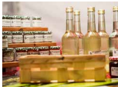
Stand auf dem Herrenberger Wochenmarkt, 21. Oktober