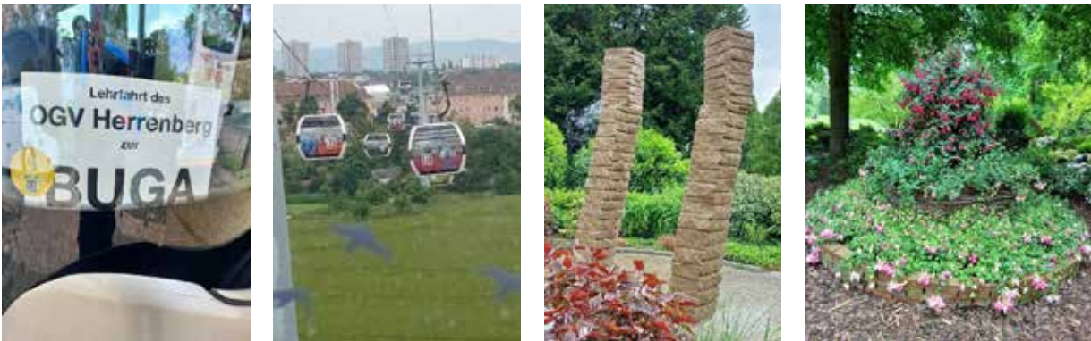
Lehrfahrt zur BUGA, 20. Mai